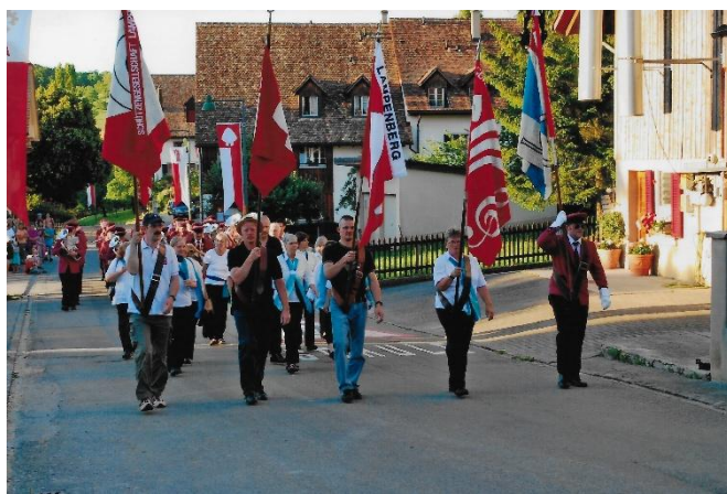
2011: Empfang danach auf dem Lampenberg