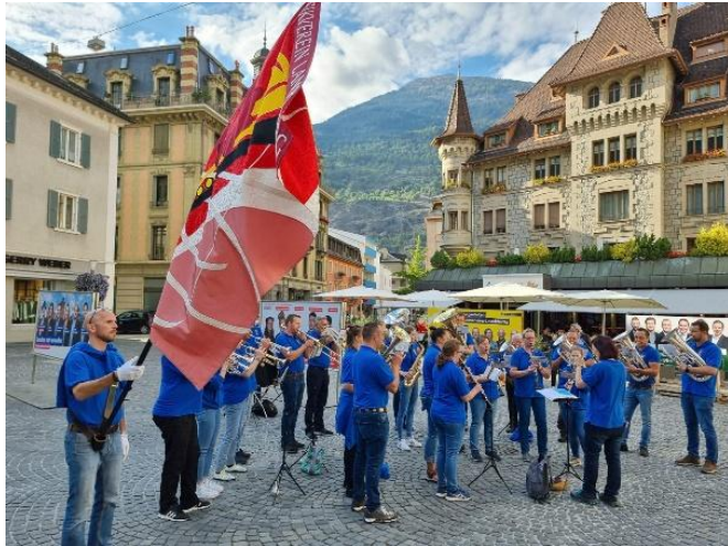
2024: Vereinsreise Wallis