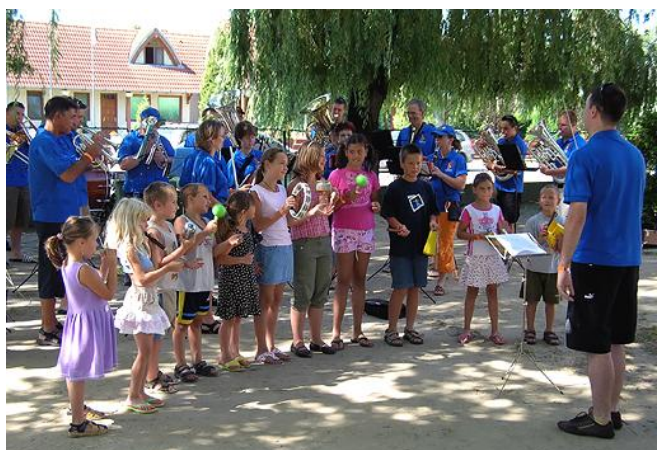
2007: Vereinsreise nach Ungarn