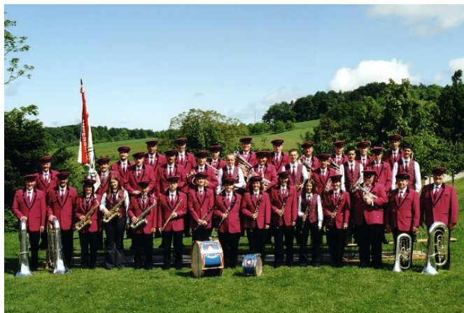
2001: 125. Jahre Jubiläum und Uniformenweihe