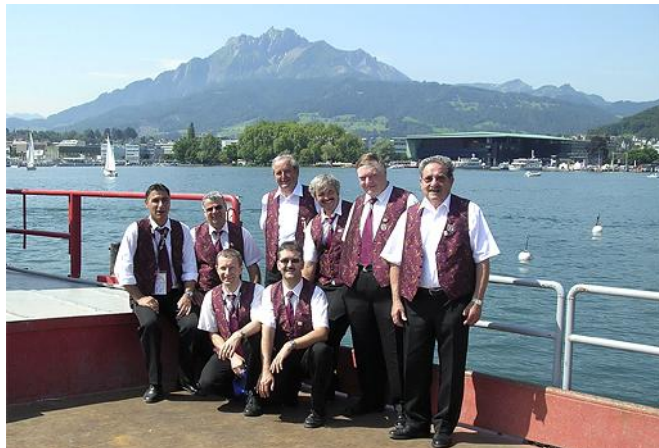
2006: Eidgenössisches Musikfest Luzern