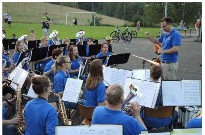
Theater und Sommernachtsfest alle zwei Jahre