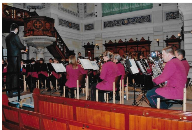
2011: Eidgenössisches Musikfest in St. Gallen